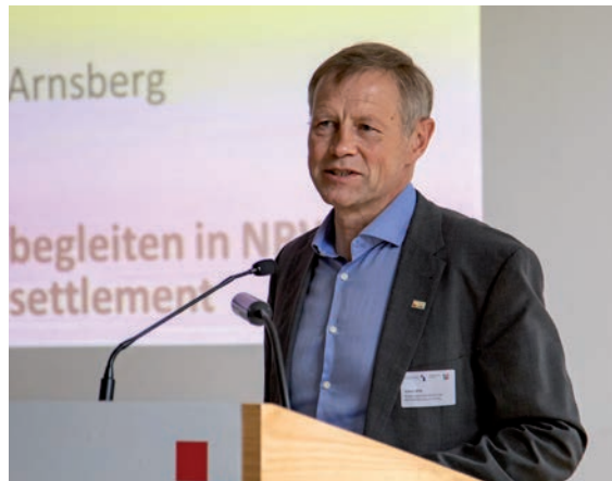
Regierungsvizepräsident Volker Milk, Bezirksregierung Arnsberg

Dieses breite, von Überzeugung getragene Engagement kommt auch in dem Pilotprojekt „Neustart im Team (NesT) – Staatlich-bürgerliches Aufnahmeprogramm für besonders schutzbedürftige Flüchtlinge“ zum Ausdruck, das jetzt beim Fachtag in Villigst im Fokus stand. Staatliche Akteure arbeiten dabei Hand in Hand mit Privaten und Kirchen zusammen, um – abseits von Asylverfahren – legale Zugangswege zu