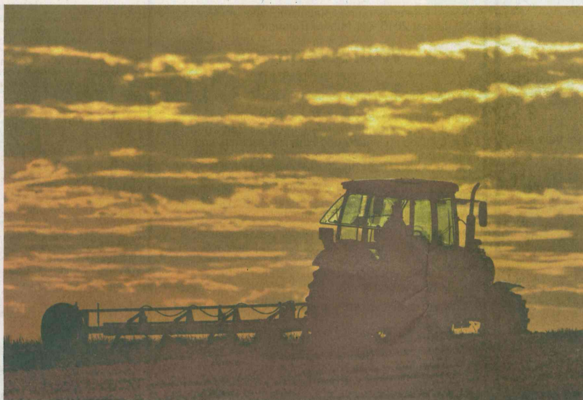
Auch das kann der Ausbau der Bundesstraße 62 bei Altenteich bringen: mehr zusammenhängende Flächen, die sich mit modernen Landmaschinen leichter bewirtschaften lassen. Die Eigentümer müssen sich allerdings einigen.

Grundstückseigentümern sowie Land- und Forstwirten bieten Bezirksregierung und Landesbetrieb ferner einen Workshop, also eine Arbeitssitzung am Montag, 15. Feb-