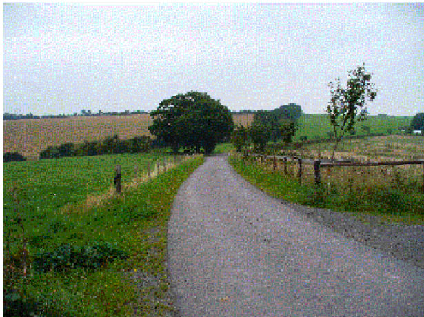
Neu erbauter Weg nach Krägeloh mit Ausgleichspflanzung am Wegesrand